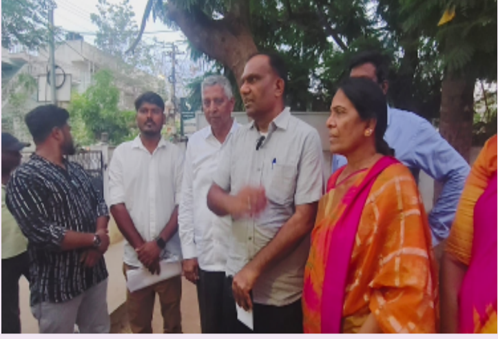
భానుపురి /సూర్యాపేట టౌన్