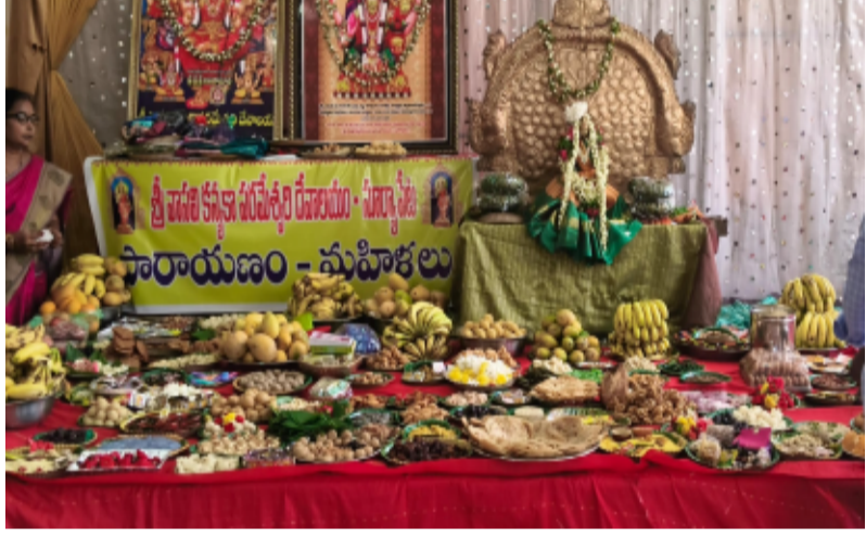
భానుపురి /సూర్యాపేట కల్లూర

అధిక జ్యేష్ఠ మానసం సందర్భంగా సూర్యాపేట జిల్లా కేంద్రంలోని శ్రీ వాసవి కన్యకా పరమేశ్వరి దేవాలయంలో శుక్రవారం 33 శాలీలతో అనేక రకాల పండ్లు, ప్రసాదాలు వాయనాలు కార్యక్రమం నిర్వహించారు. ఈ సందర్భంగా వాసవి మాతకు ప్రత్యేక అభిషేకాలు నిర్వహించారు. పట్టణ వస్త్రములు అలంకరించేసి పూజలు నిర్వహించారు. ఈ కార్యక్రమం లో మహిళలు పెద్ద ఎత్తున పాల్గొన్నారు.