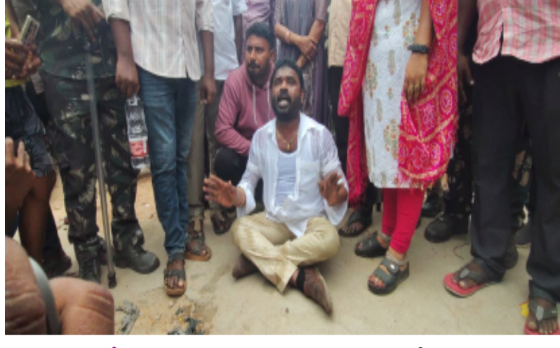
భానుపురి / సూర్యాపేట టౌన్

సూర్యాపేట పట్టణంలోని అంజనపురి కాలనీ నందు గల వజ్ర టౌన్ షిప్ లో బలహీన వర్గాలు, ఉద్యోగులు, వ్యాపారస్తులు తాము కష్టపడి సంపాదించిన డబ్బుతో కొనుగోలు చేసిన ఇళ్లను అక్రమంగా వేరొకరికి రిజిస్ట్రేషన్ చేస్తున్నారని తెలంగాణ రాజ్యాధికార పార్టీ రాష్ట్ర ప్రధాన కార్యదర్శి వట్ల జానయ్య యాదవ్ అన్నారు. శుక్రవారం వజ్ర టౌన్ షిప్ లో షాట్ల యజమాని మరొకసారి అక్రమంగా రిజిస్ట్రేషన్ చేసేందుకు నల్లు ఉమా జ్యోతి రెడ్డి రిజిస్ట్రేషన్ కార్యాలయానికి వస్తున్నారని, ఈ నేపథ్యంలో ఆ రిజిస్ట్రేషన్ ను అడ్డుకునేందుకు కొనుగోలు చేసిన ఇళ్ల నిర్మించిన వారితో కలిసి కార్యాలయం వచ్చారు. ఈ క్రమంలో ఇది లా అండ్ ఆర్డర్ కు భంగం కలిగించేలా ఉందని పట్టణ సిబ్బంది వెంకటయ్య వారిని అడ్డుకోవడంతో ఉద్రిక్తత నెలకొంది. ఈ సందర్భంగా వట్ల జానయ్య యాదవ్ విలేజ్ కరలతో మాట్లాడుతూ..... మాజీ మంత్రి